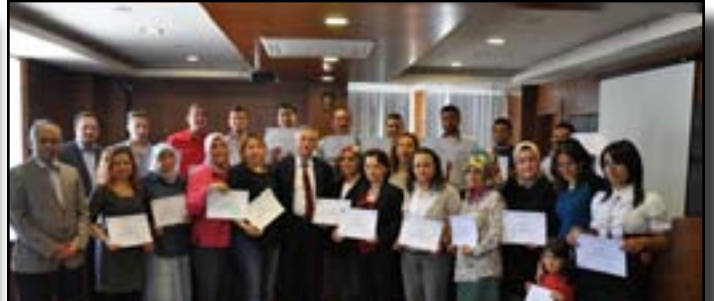
UYGULAMALI GİRİŞİMCİLİK EĞİTİMİ SERTİFİKA TÖRENİ