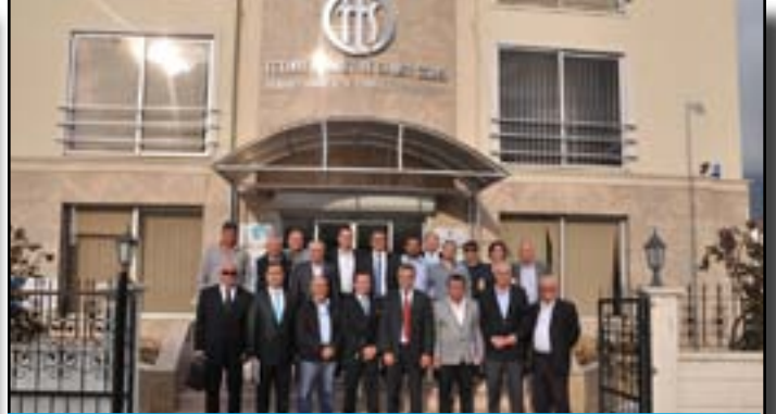
FTSO MECLİSİ SEÇİMDEN ÖNCEKİ SON OLAGAN TOPLANTISI