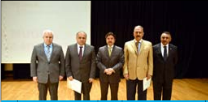
İŞKUR'DAN FETHİYE TİCARET VE SANAYİ ODASINA TEŞEKKÜR