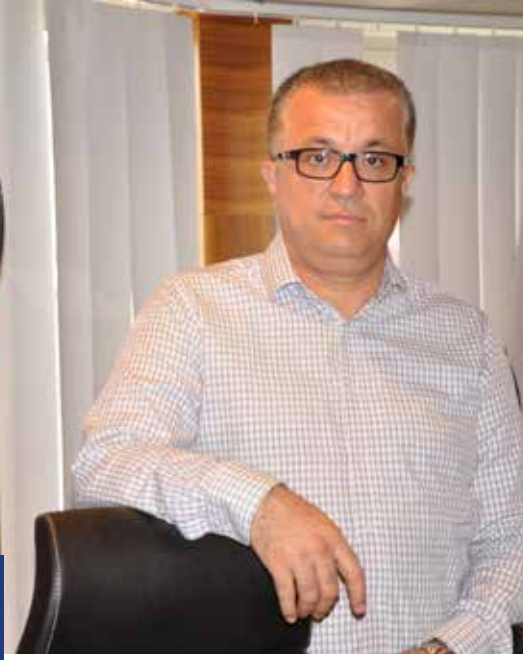
Mustafa BÜYÜKTEKE Meclis Başkanı